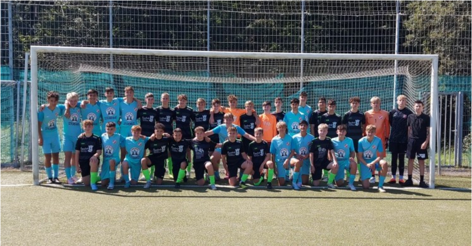
Foto: Turniersieger RW Darmstadt (in blau) und die JSG Brechen/Weyer

Im großen Halbfinale ließ SKV Rot-Weiß Darmstadt gegen den FC Bayern Alzenau nichts anbrennen und setzte sich deutlich mit 6:0 durch. Im zweiten